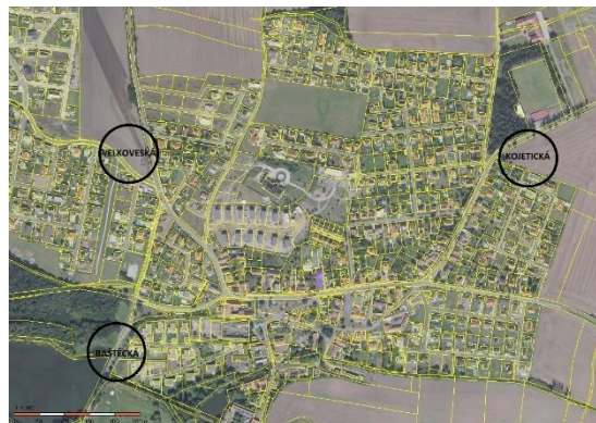
Obrázek 2: Umístění zastávek

Poslední řešenou oblastí, neméně důležitou zejména s výhledem do budoucna, je lokalita při Čenkovské ulici, na velkém pozemku ve vlastnictví obce, směrem na Velikou Ves, kde variantních řešení bylo zpracováno hned šest. Zde se naskytá prostor pro obratiště i parkoviště a toto řešení autobusové zastávky, zejména vjezd a výjezd, je vhodné konfrontovat s možností napojení Předboje na další alternativní autobusové linky do Prahy a