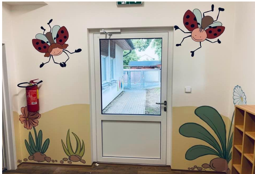
Obrázek 1: Ukázka výzdoby nové třídy

Pro projekt přístavby 3. třídy mateřské školy bylo v květnu roku 2020 vydáno stavební povolení, byla také podána žádost o dotaci z Integrovaného regionálního operačního programu prostřednictvím poskytovatele dotace Ministerstva pro místní rozvoj, která byla uznána ve výši 8,5 mil. Kč. Poté následovaly další formální a organizační úkony spojené se zajištěním zhotovitele stavby.