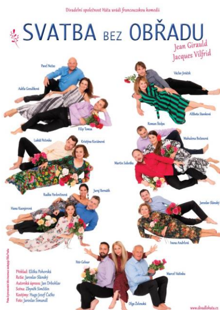
Obrázek 6: © 2022 © Divadlo Palace Praha