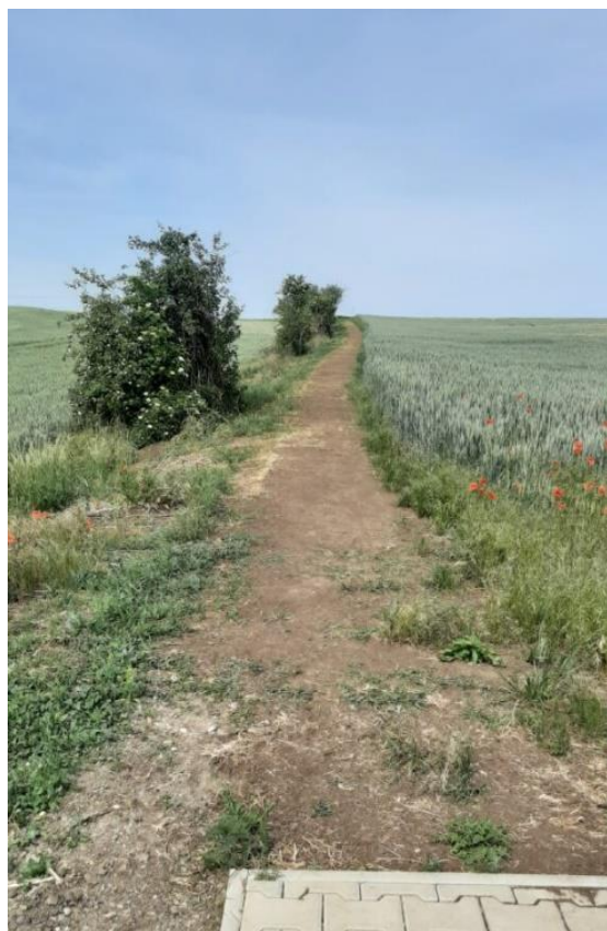
Obrázek 4: Polní cesta do Břežan