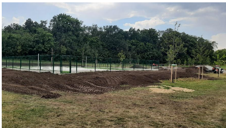
Obrázek 5: Beachvolejbalové hřiště

Tento projekt byl o to složitější, že jsme ho neřešili tzv. na klíč. Především proto se nám při jeho realizaci nejvíce projevil dopad problémů posledních dvou let, a to vytížení stavebních firem a dodavatelů materiálu.